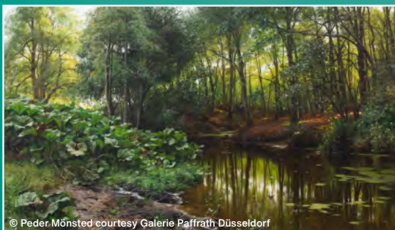
© Peder Mönsted courtesy Galerie Paffrath Düsseldorf