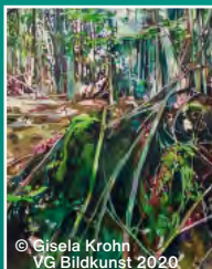
© Gisela Krohn VG Bildkunst 2020